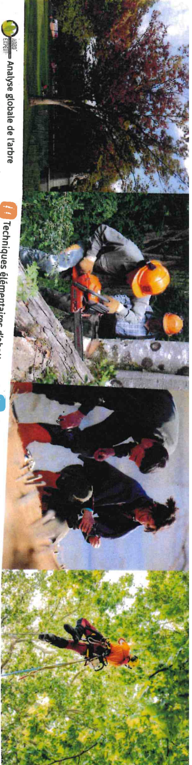
Analyse globale de l'arbre