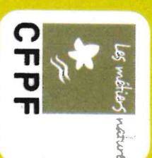
Techniques de grimper et déplacement